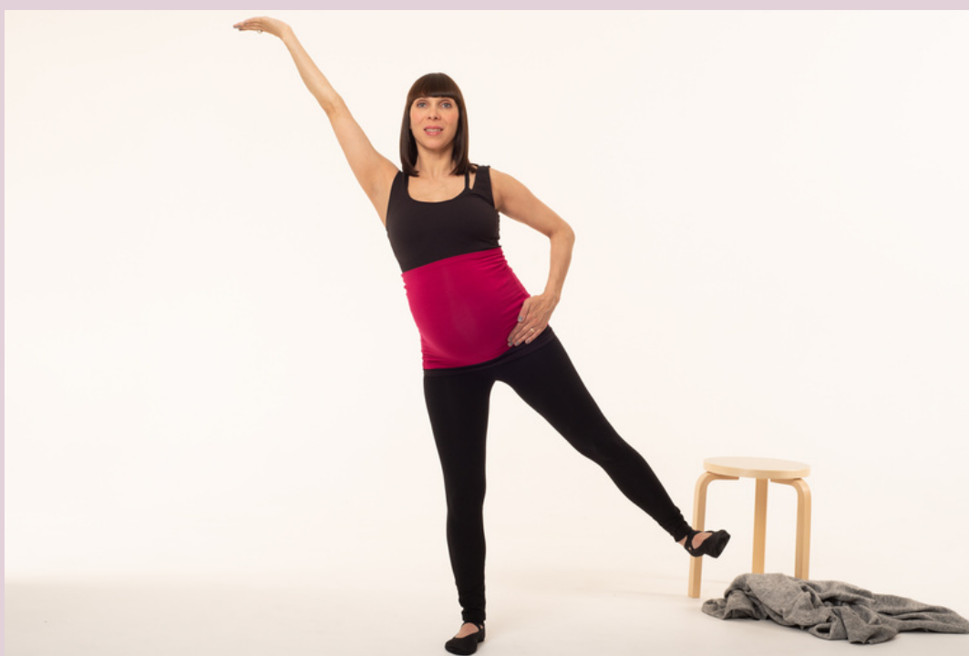
Instabilität im Einbeinstand

Gleichzeitig sind Gleichgewichtsübungen auch eine gute Möglichkeit, die Körperwahrnehmung über die Sensibilisierung für die Körperhaltung und –balance zu schulen, sowie für das Nachspüren von Spannung und Entspannung. In der Schwangerschaft ändert sich die Statik deines Körpers ja immer weiter, sodass Gleichgewichtsübungen oft eine große Herausforderung sind. Solltest du dich in irgendeiner Weise unsicher im Einbeinstand fühlen, halte dich gern an der Wand oder an einem Tisch während der Übung leicht fest.